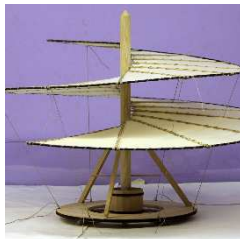
La vis aérienne (Maquette Artes Mechanicae)