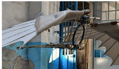
L'ornithoptère (Maquette Artes Mechanicae)