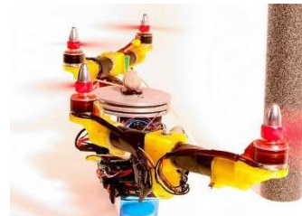
Le Quad-Morphing (Drone à ailes repliables en vol du CNRS de Marseille)