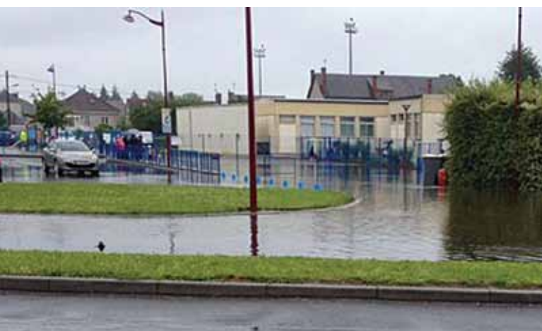
L'école des Tuileries