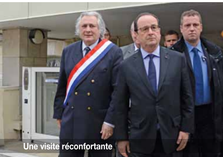
Une visite réconfortante