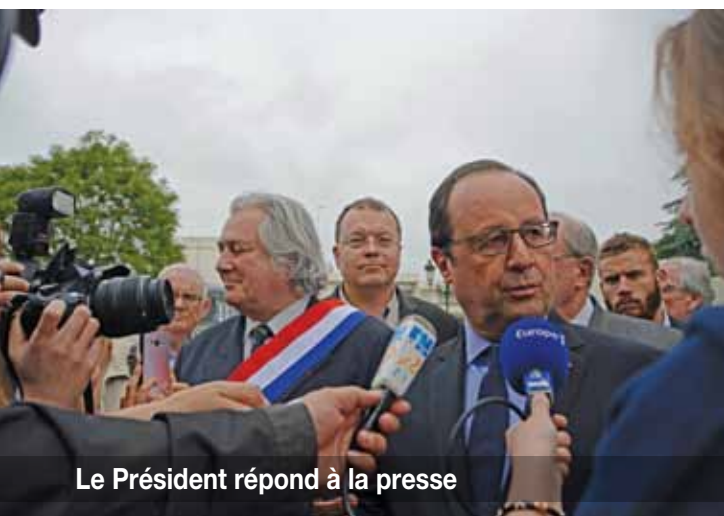
Le Président répond à la presse