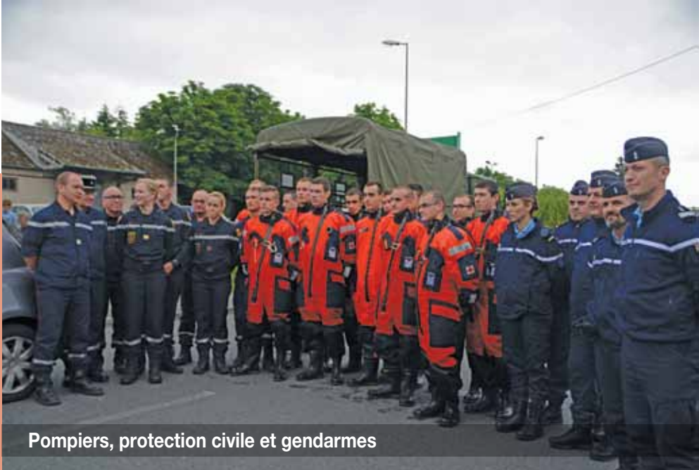
Pompiers, protection civile et gendarmes

» Les employés de la Ville se mobilisent assurant accueil, relogement, préparation des repas par les cantines, nettoyage et déblaiement.