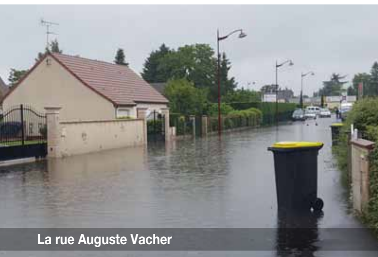
La rue Auguste Vacher

» Mais la crue millénaire dépasse très largement celle de 1910, de 70 cm, et prend tout le monde au dépourvu.