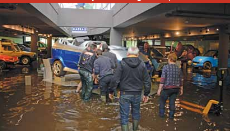
Après un long travail, le musée Matra a rouvert ses portes le jeudi 16 juin

Le semestriel de la Ville, Romo Dialogues de juin 2016 et le Romoscope n°2 ayant été imprimés avant ces événements, ne tiennent pas compte de ces annulations.