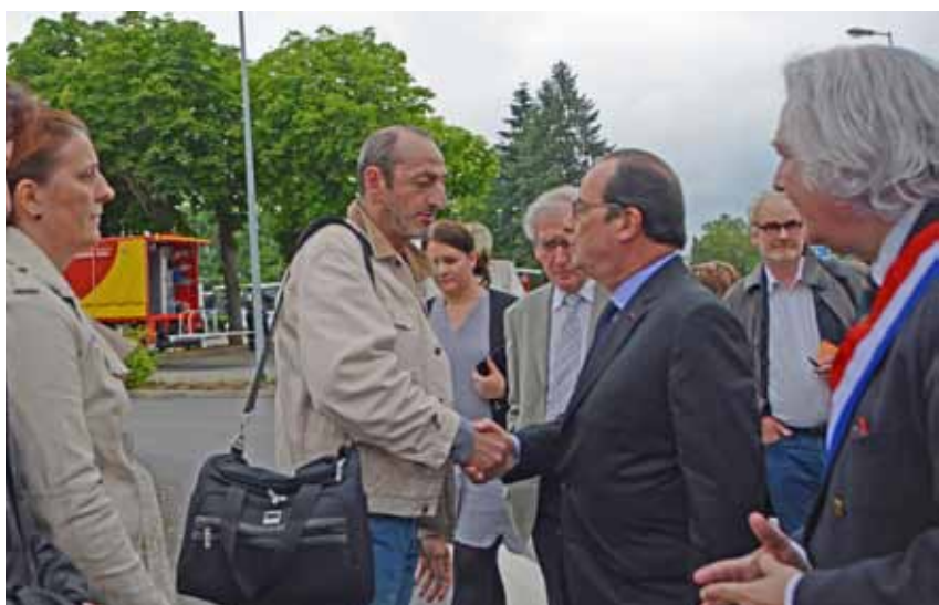
Le Président soutient les habitants sinistrés

Le Sénateur-Maire a quant à lui été très touché par ce geste symbolique et amical à l'égard de la population romorantinaise.