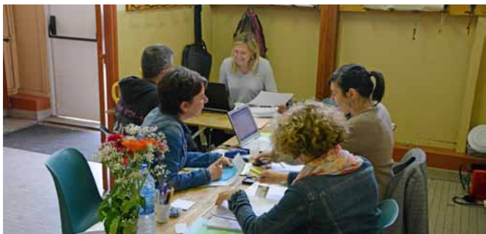
L'accueil s'organise au gymnase Ladoumègue