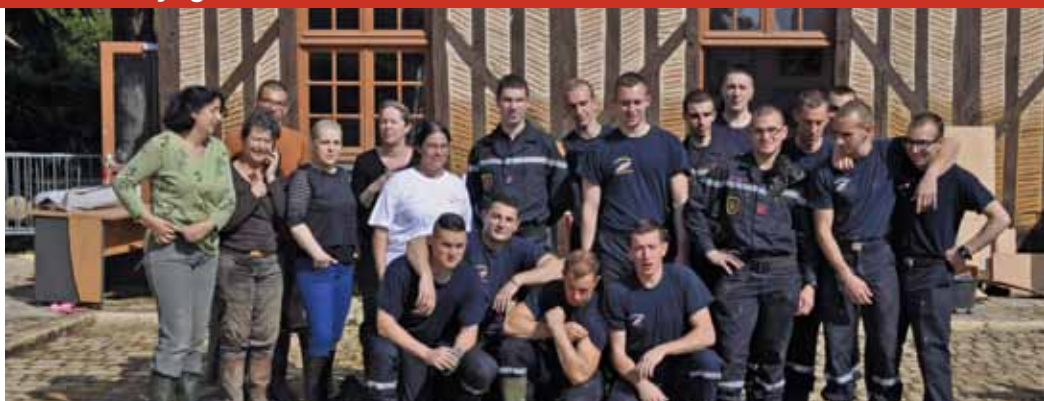
Une équipe en renfort à la M.J.C