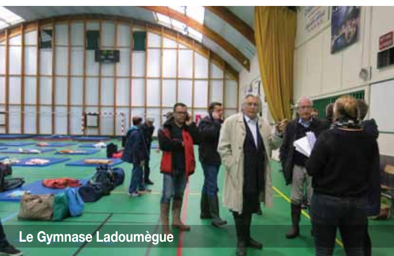
Le Gymnase Ladoumègue