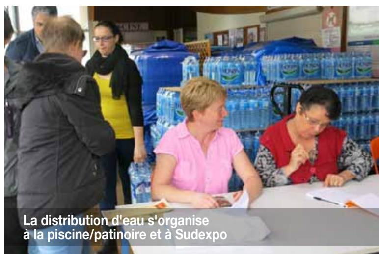
La distribution d'eau s'organise à la piscine/patinoire et à Sudexpo

» Devant l'ampleur des dégâts et la situation catastrophique, une cellule de crise dirigée par le Sénateur-Maire, avec les services de l'Etat est créée.