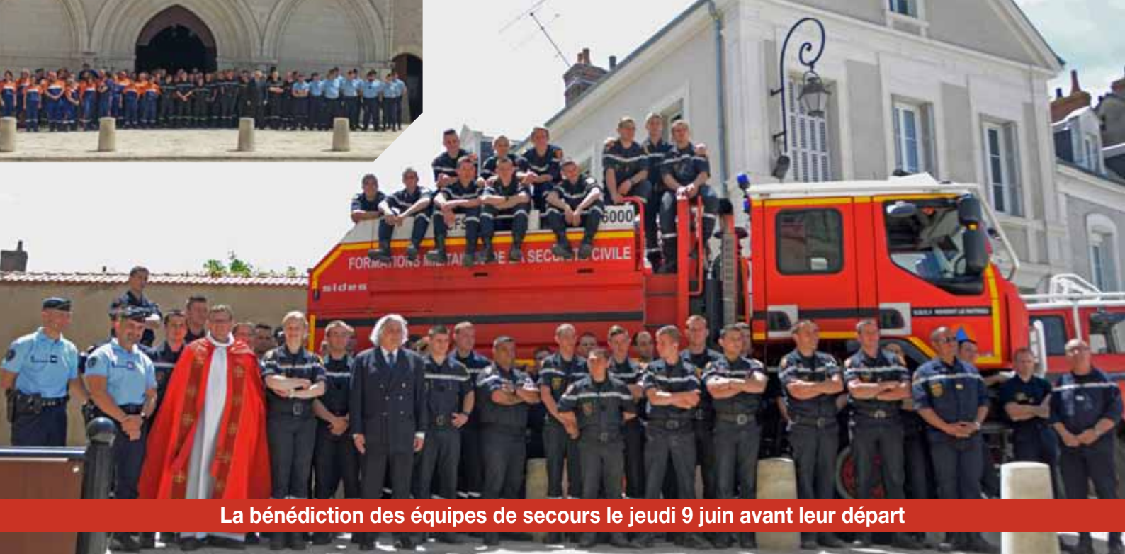
La bénédiction des équipes de secours le jeudi 9 juin avant leur départ