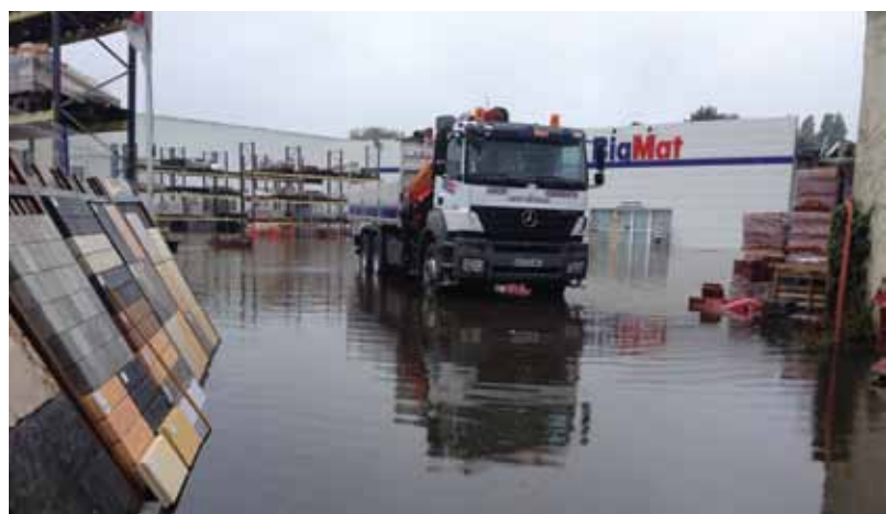
La rue de la Forêt