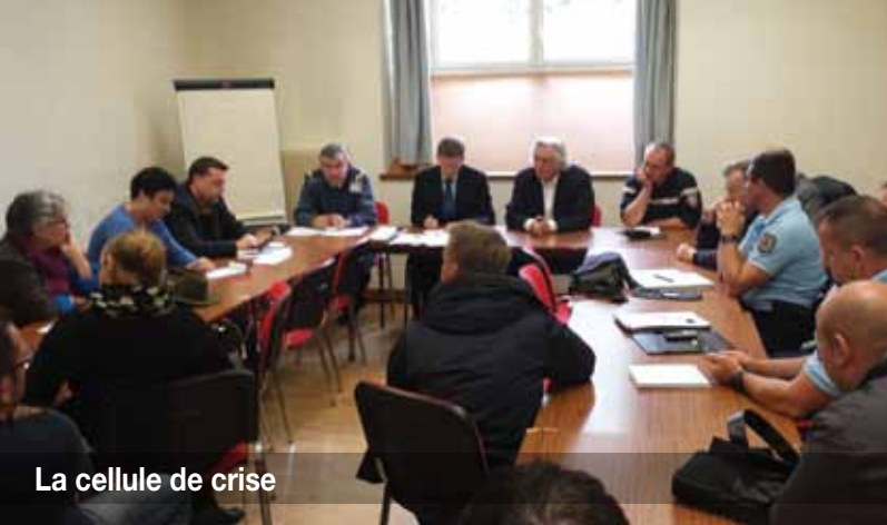
La cellule de crise