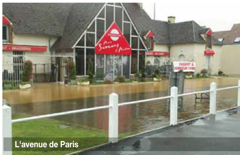
L'avenue de Paris