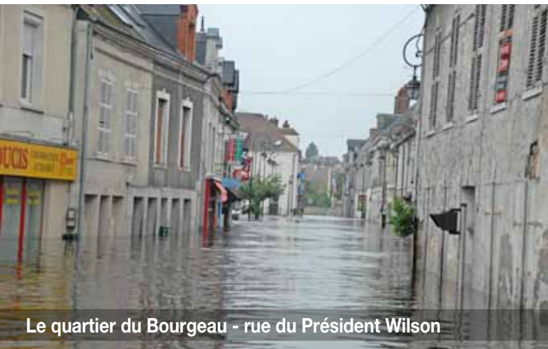
Le quartier du Bourgeau - rue du Président Wilson