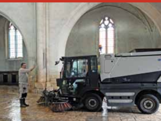
Le curé bénit la balayeuse municipale