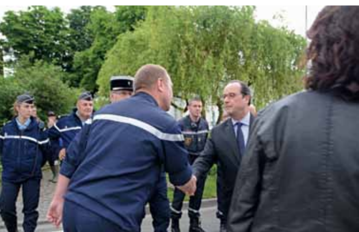
François Hollande salue les secours